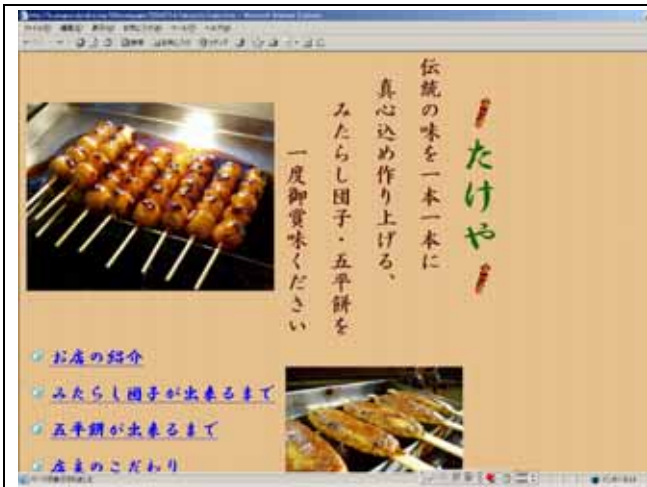
竹内製菓（だんご屋）