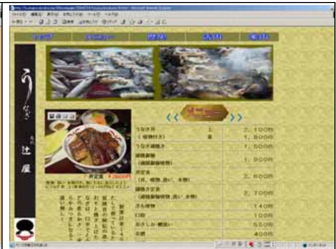
辻屋（うなぎ専門店）