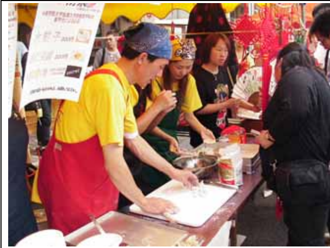
刃物祭り（留学生による手作り餃子）