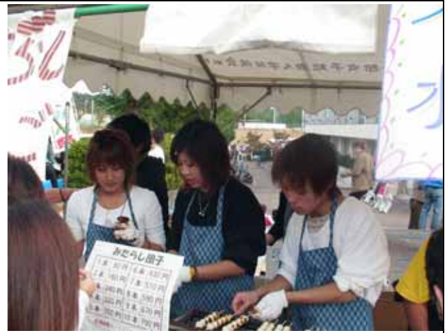
たのしみん祭（だんご・五平餅）

地域における活動を通して、人間力（コミュニケーション能力、問題発見・解決能力）の育成を目指している。特に経営学科（現経営情報学科）の特性を生かし、販売等を中心に、イベントにおけるボランティア等を含め活動している。