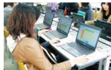
電子ポートフォリオ操作風景