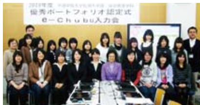
電子ポートフォリオ認定式

さらに幼稚園・保育所・児童福祉施設の職員の方々に評価委員を委嘱し、公開フォーラムで成果を明らかにしていきたいと考えています。