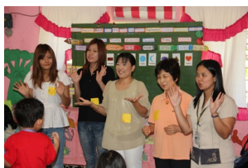
パグアサ・センターで交流