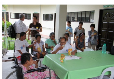
フィリピンの利用者たちと交流