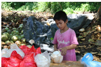
木陰で椰子ジュースはいかが

海辺でビーチ・バレーや砂遊び、貝拾いなどをして遊んだ後、もう一度舟に乗ってダバオに帰りました。濡れたままの服を気にしながら、ホテルに帰着。夕食は近くの日本料理店で麺類や丼ものを食べました。これもまた、大変おいしかったです。