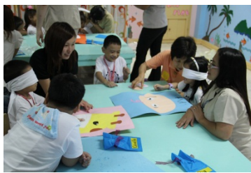
じゃあやってみよう！