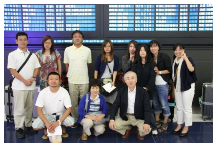
全員無事に帰着しました

以下は最後に残しておきました、8月21日（火）のビーチでの休日の様子です。お読みいただければ、うれしく思います。