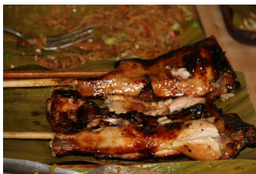
ダバオは炭火焼きが有名