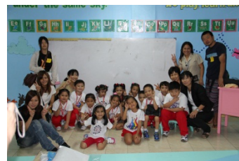
国際学校の「年長さん」と

国際学校で子どもたちとお別れをした後、3班に分かれてダバオ市内のモールに行きました。タクシーの手違いで別のモールに連れて行かれ、結局は2グループに分かれてのショッピングでした。そして夕食は、近くの炭火焼きのお店で「最後の晚餐」を行いました。皆さん、フィリピンの味には慣れた感じで、またしても満腹になるまで食べてしまいました。