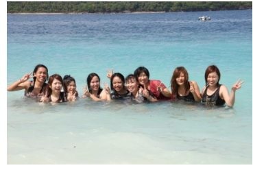
MKD の学生と本学参加者