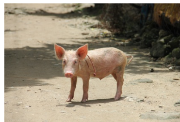
コブタもわれらを歓迎