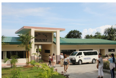
コスギアン老人ホーム

夕方はミンダナオ国際大学の教職員との夕食会が催され、私たちは招待に与りました。このように大学あげて歓迎して下さったことに心から感謝いたします。