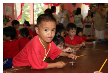
「年中組」の子どもたち