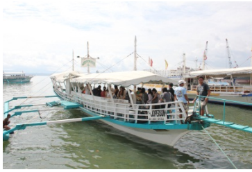
タリカッド島行きダブルリガー